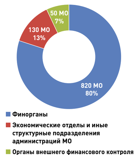
Рисунок 4. Численность сотрудников органов, осуществляющих контроль в сфере закупок